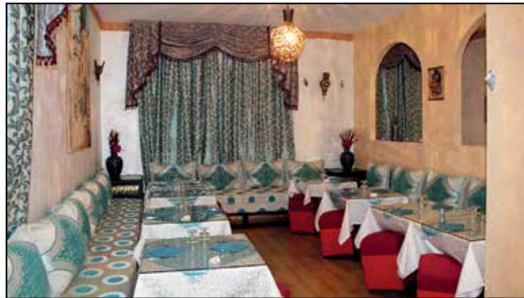
LE DUE SALE ACCOGLIENTI

MENU' ALLA CARTA PIATTI DELLA CUCINA SIRIANA VINO BIANCO-ROSSO-BIRRA-GRAPPA SIRIANI