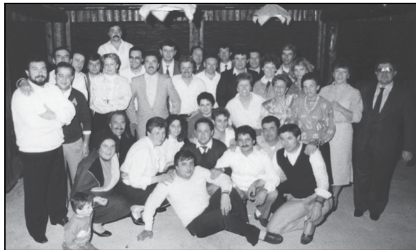
Un ricordo della classe in bianco e nero.