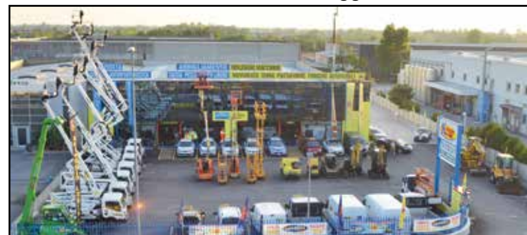
La nuova sede della Noleggio Lorini in zona industriale, via E. Montale 15.

SEDE: MONTICHIARI (BS) - Via E. Montale, 15 FILIALI: CALCINATO - CASTEGNATO tel. 030.9650556 - www.noleggiolorini.com