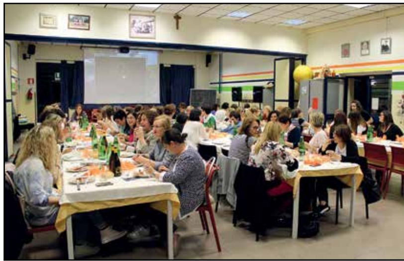
Le partecipanti alla piacevole serata.

Quindi, dopo l'incontro con i papà è il turno delle mamme che si sono ritrovate la sera del 15 maggio, circa 75, presenti all'invito di don Alberto. Una cena speciale (un primo partico-